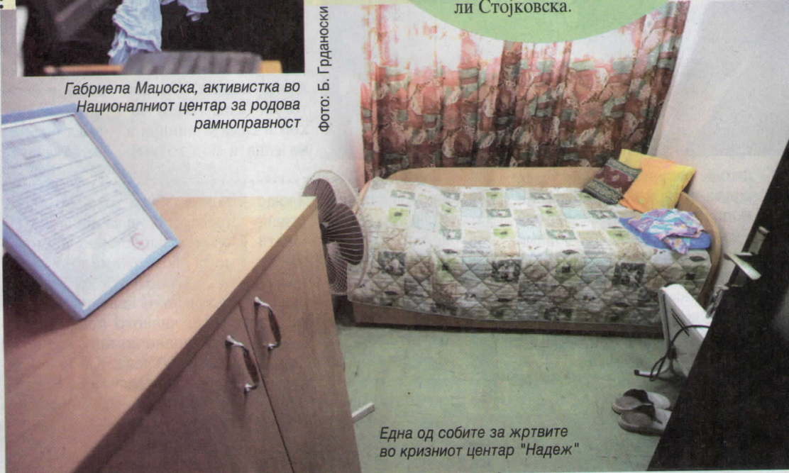
Една од собите за жртвите во кризниот центар "Надеж"