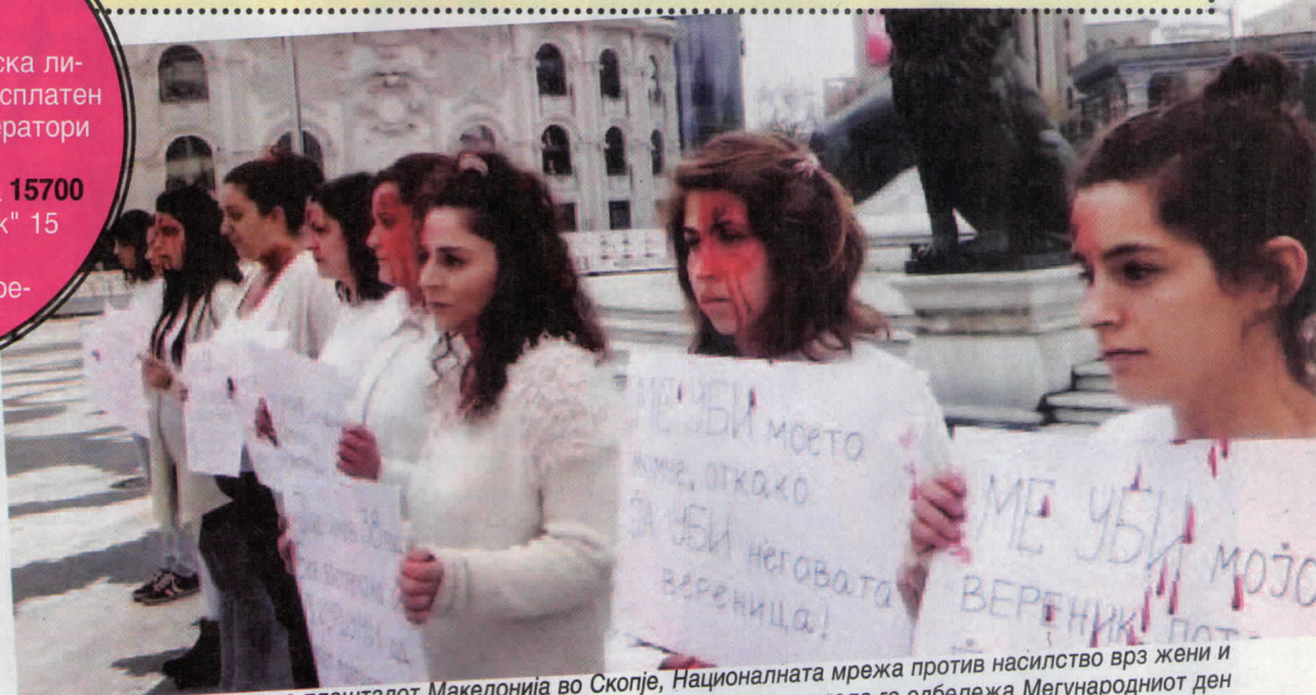
Со перформанс на плоштадот Македонија во Скопје, Националната мрежа против насилство врз жени и семејно насилство минатата недела го одбележа Меѓународниот ден против насилство врз жените